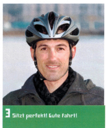
3 Sitzt perfekt! Gute Fahrt!